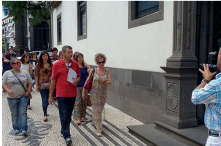
A redução de professores foi cerca de 7% face ao ano letivo anterior, superior à redução de alunos

e nas baixas médicas; e necessidade de reparar a injustiça dos professores