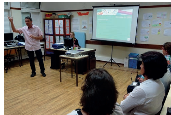
SPM nas escolas: informar, apoiar e ouvir os colegas sobre os problemas que mais preocupam e desgastam, para estruturar a luta reivindicativa